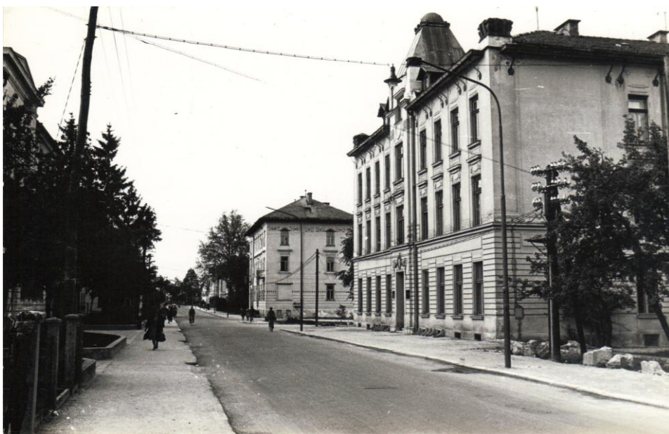
Novo križišče med Hranilnico in Posojilnico, ok. 1960